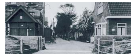
De coupure rond 1915 (links), 1930 (boven) en 2006 (onder).

Aan het begin van de Dorpsstraat staat de 'coupure'. Zo heet in waterstaatkundige taal een onderbreking of een doorsnijding van een waterkering. De Vlielandse coupure bevindt zich in de Waddendijk die hier landinwaarts afbuigt en de Dorpsstraat kruist. Al in 1827 is men begonnen de wal aan de zuidzijde van het eiland om te vormen tot een dijk. Pas in de jaren negentig van de negentiende eeuw werd ook een dijk aangelegd aan de oostzijde van het dorp. Hoewel 'dijk' daar misschien wel een te groot woord voor was: het was niet meer dan een aarden wal en de Dorpsstraat kon worden afgesloten met een houten schutting van zo'n meter hoog. In 1931/34 werd in verband met de aanleg van de Afsluitdijk de hele dijk van Vlieland met een meter verhoogd. In 1953 werd tijdens de watersnood pijnlijk duidelijk dat dit niet voldoende was. De dijk werd in drie stappen verhoogd tot zogenaamde Delta-hoogte, de hoogte die voorgeschreven is in de wet die de Deltawerken regelt. Vandaar dat de coupure nu een massieve betonnen structuur heeft die in niets meer lijkt op een houten schutting.