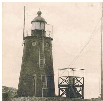
De oude bakstenen 'lichttoren' rond 1901.

Houten huisje waarin de boot van de Reddingmaatschappij werd gestald. Vroeger werd de boot op een karrenwagen door vier paarden naar zee getrokken. In de twintigste eeuw zijn de paarden door een tractor vervangen. De schuur is in 2005 gerestaureerd.