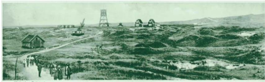
Vlieland - Duinker

bakstenen bouwwerkje is, maar de kracht ervan zit in de geleiding: het hoge steile dak, met in het midden de uitsprong van de toegangspartij. Maar ook de latere aanbouw aan de noordelijke kant die even naar achteren springt (en vermoedelijk heeft er net zo'n uitbreiding aan de zuidkant bestaan). Vooral aan de achterzijde (zie pagina 2) is te zien hoe op bijna vanzelfsprekende, maar toch op simpele wijze, er een haast overonderende compositie ontstaat.